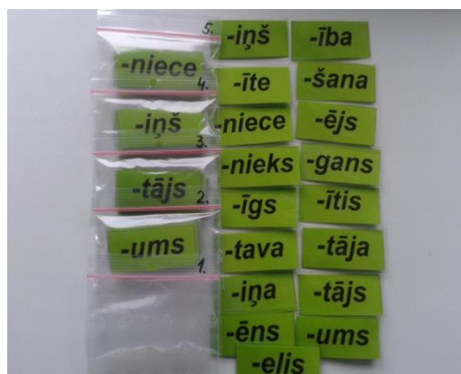
5 maisiņi ar izskaņu kartītēm