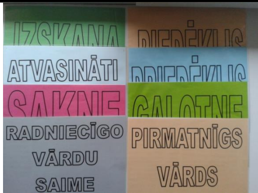
8 jēdzienu plakāti