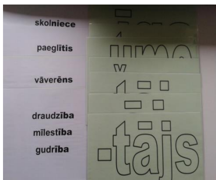
17 izskaņu plakāti