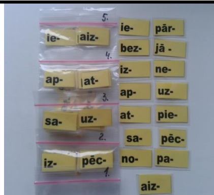
5 maisiņi ar priedēkļu kartītēm