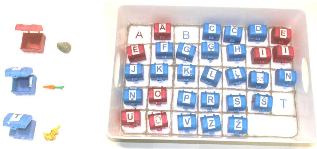
Alfabēta kaste un smilšpapīra burti